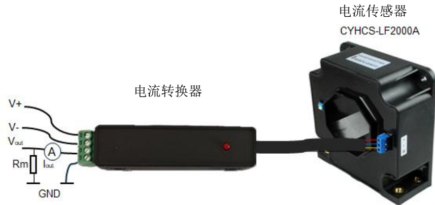
图 3 转换器与传感器测量连接

传感器 CYHCS-LF2000A 与默认 40 mA 输出的转换器组合使用示例。