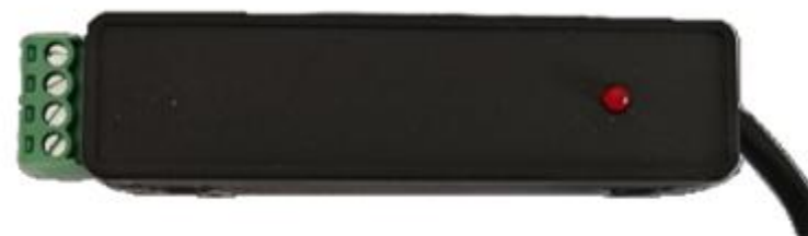
图 1 转换器壳体